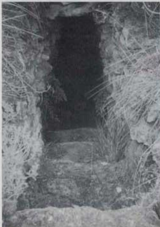
Cinc esglaons per baixar a l'albelló.

Tot i que pot ésser una mica arriscat per les persones que no estan avesades, és colpidor endirar-s'hi i seguir els albellons. Impressiona la fondària dels pous tant si es miren des de dalt com des de baix. Els van fer per treure la terra quan excavaren els albellons, a més a més donen llum a aquesta conducció subterrània d'aigua. Per treure la terra empraven l'argue -aquesta màquina, ja en desús,