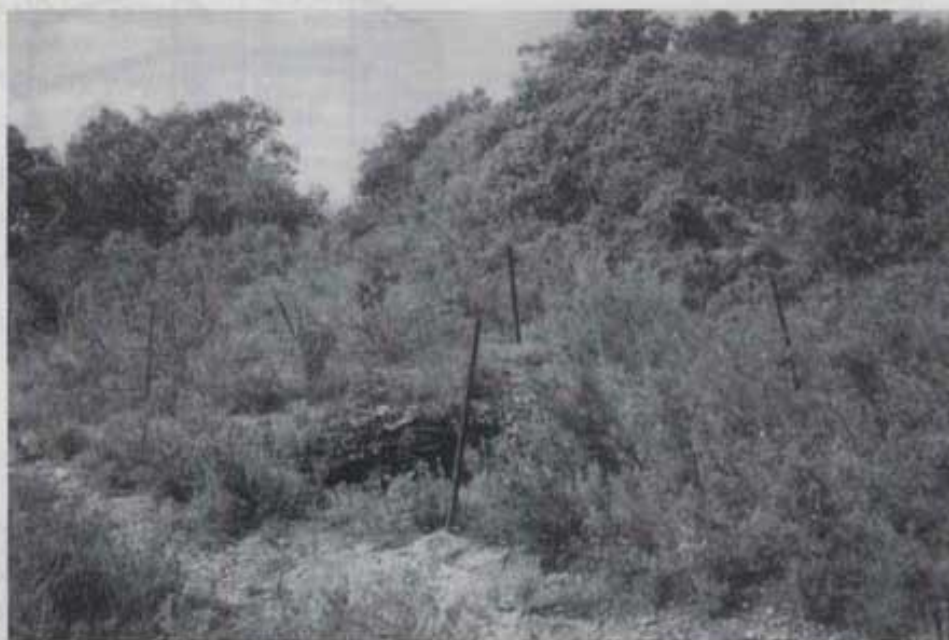
Els piquets envoltats de filferro protegeixen la boca del pou.

A la bassa del Mas Nou (255 44699), situada a la dreta del barranc de Borrell hi vessaven dos rajos d'aigua, un per cada albelló, i dic vessaven perquè a hores d'ara no raja ningú de tots dos. Malgrat la sequera pertinaç que patim, encara hi ha aigua a la bassa, però a un nivell inferior a la meitat. Per l'albelló ja no circula l'aigua o ho fa molt lentament. En baixar