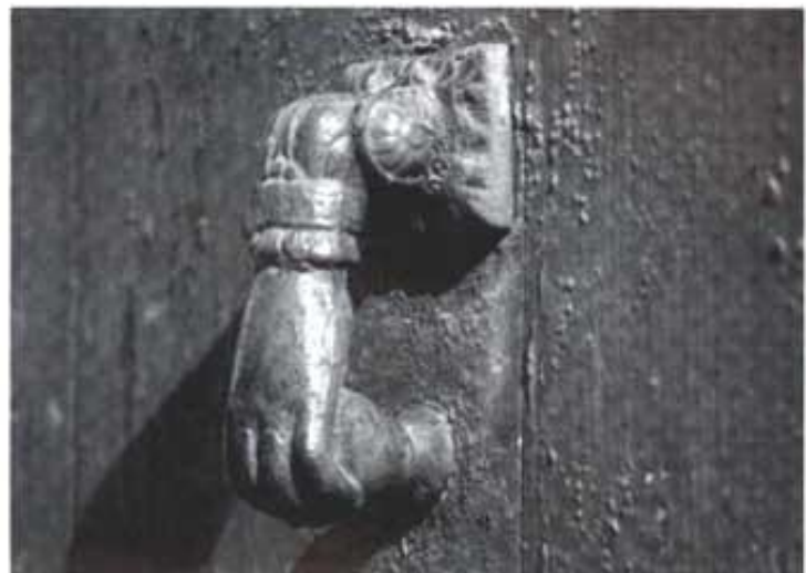
C/ Sant Antoni.