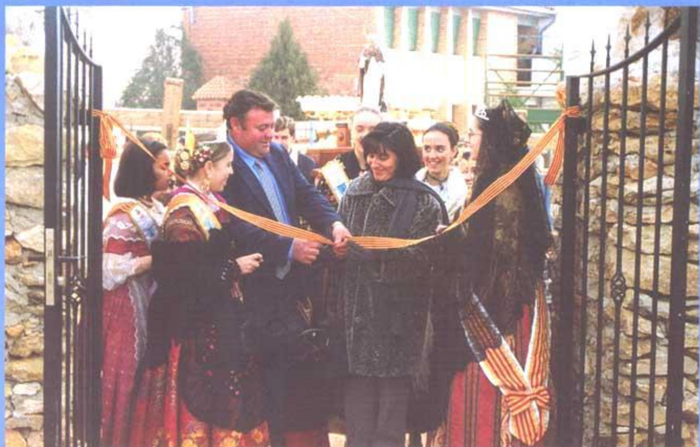
MAS D'EN RIERES. INAUGURACIÓ DE LA BARBACOA