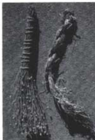
Raspall (a l'esquerra) i vencill (a la dreta). Són una prova de l'aprofitament que l'home del món rural feia, en temps passats, dels elements de la natura, ja que els dos estan fets totalment de plantes. El vencill, emprat per a nuar les garbes i el raspall per a escombrar l'era després de batre.