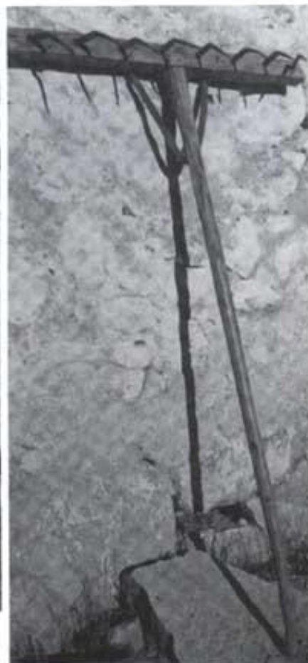
Rastell amb pues de ferro.