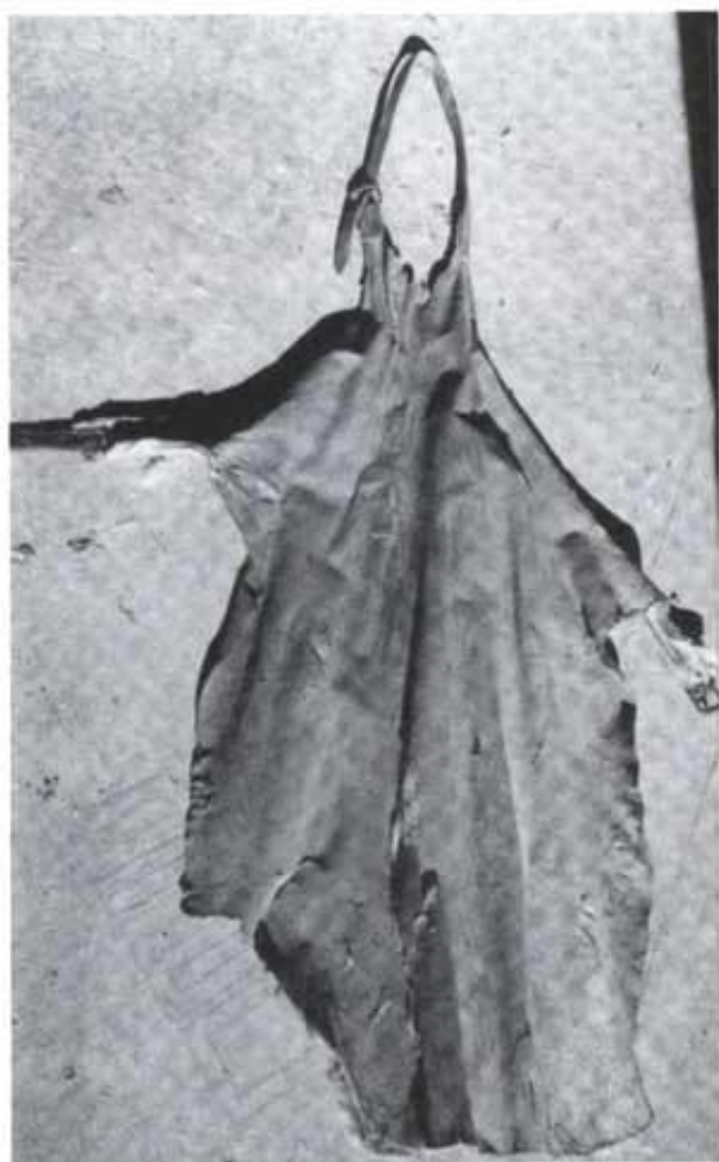
Samarra o tapanta. Peça molt semblant a un davantal, feta de pell de cabra amb unes corretges per a subjectar-la al cos i emprada per a protegir-se de l'aspror del cereal al segar.

da. Es tracta d'eines que han pogut burlar el pas del temps i, encara que es troben en desús, han aplegat als nostres dies per fer de testimonis d'èpoques passades.