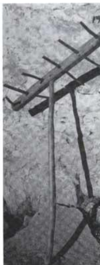
Rastell o engavellador. S'utilitzava entre altres coses per a replegar les tiges del cereal segat amb dalla.