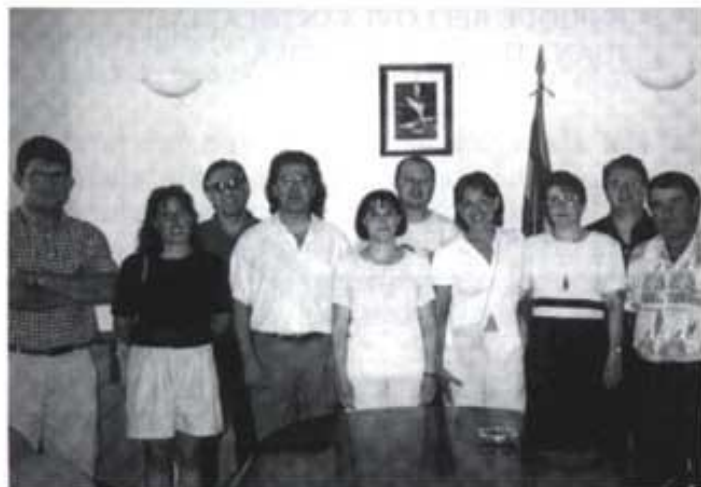
El nou Consell de la Vila i Secretari.

El Consell de la Vila aprova aquesta proposta per unanimitat.