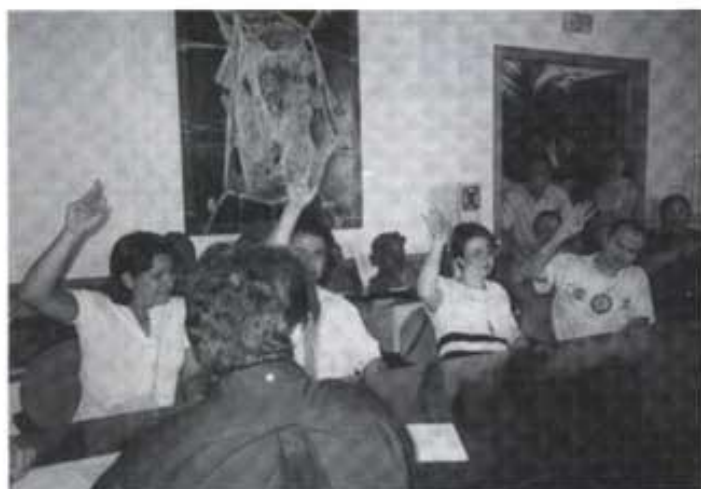
Votant a l'Alcaldessa.