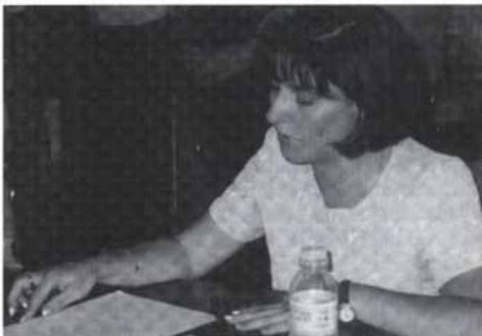
Gemma prometent el càrrec.