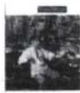
Ramón Gómez de la Serna

• De Ramón Gómez de la Serna " Obras Completas V: Ramonismo III ", inclou Libro nuevo, Disparates, Variaciones, El alba publicades entre 1920-1923.