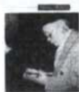
Pío Baroja ENSAYOS

Edwidge Danticat denuncia, amb un llenguatge comovedor i líric, l'opressió que sofríx la dona haitiana, la mare, guardiana de la virginitat de les seues filles, transforme el sexe en un experiència dolorosa i cruel.