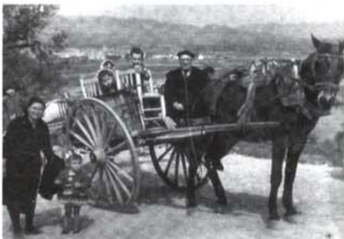
Anant de festa. Aquesta foto és de l'arxiu de la família Macip de Sant Mateu. Fa uns 40 anys aproximadament que està feta. Observeu que no porta sorra, va amb entaulats.

Un altre element característic dels carros, sobretot els d'aquesta comarca, és la sorra o soto . Es tracta d'una pla-