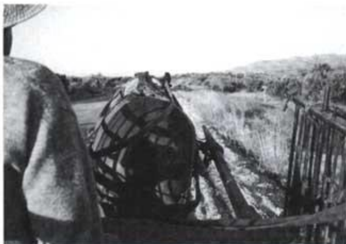
Cap a la sènia. Un altre carro dels pocs que encara es poden veure per la carretera. Aquest és de la Salzedella. El seu propietari em va deixar anar damunt una estona. Es veien passar els cotxes molt de pressa.

col. El cèrcol es tallava uns centímetres més curt que la roda, i després de doblar-lo s'unien les puntes. Per a posar-lo s'havia d'escalfar prèviament, ja que al dilatar-se agafava el perímetre necessari per a que la roda entrés. Una volta posat, hi havia que refredar-lo ràpidament perquè, de no ser així, es podia cremar la fusta de les trossades. Fent voltar la roda per dins d'un clot o una pica amb aigua es refredava el cèrcol i llavors atapeïa la roda donant-li consistència. S'acabava de subjectar amb uns claus anomenats reblons que, travessant el cèrcol, es clavaven als camons o trossades.