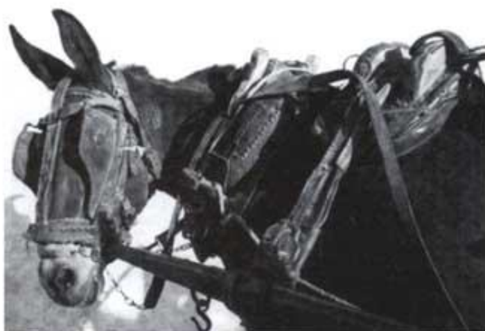
El matxo també vol eixir a la foto.

plantar el carro. Llavors es posava el sistema de fre elegit. El més rudimentari era la galga . Es tractava simplement d'un tarranc de fusta que, eixint del costat de la barra del carro, passava per costat de fora de la roda i es nugava amb una corda a la part de darrere. Per a frenar calia prémer la