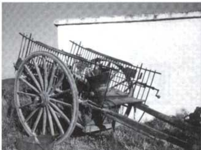
Carro devenganxat. Es poden veure les diferents peces que el formen.

Amb l'escalada i les rodes fetes es podia posar l'eix o fuel·l amb el piu a la punta per a que no eixiren les rodes i