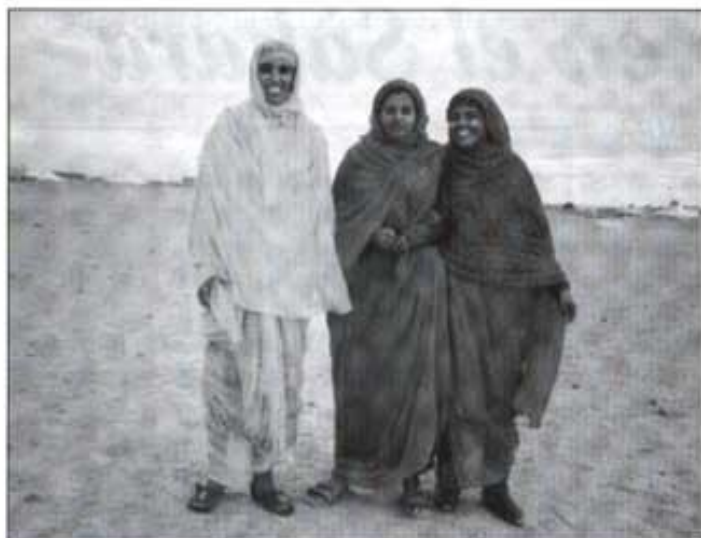
Algunes de les alumnes de l'escola Olof Palmer.

El taller amb les màquines es va montar a la Escuela de Mujeres Olof Palmer, que està en Hagunia (El Aaiún). Totes eren xiques joves amb ganes d'aprendre. Algunes d'elles venien a l'escola cada matí caminant pel desert més d'una hora. Parlaven en hasania (dialecte àrab que es parla allà), per això tenia un traductor, Dut, que va ser de gran ajuda per a mí. Vos diré el nom d'algunes d'elles: Natu,