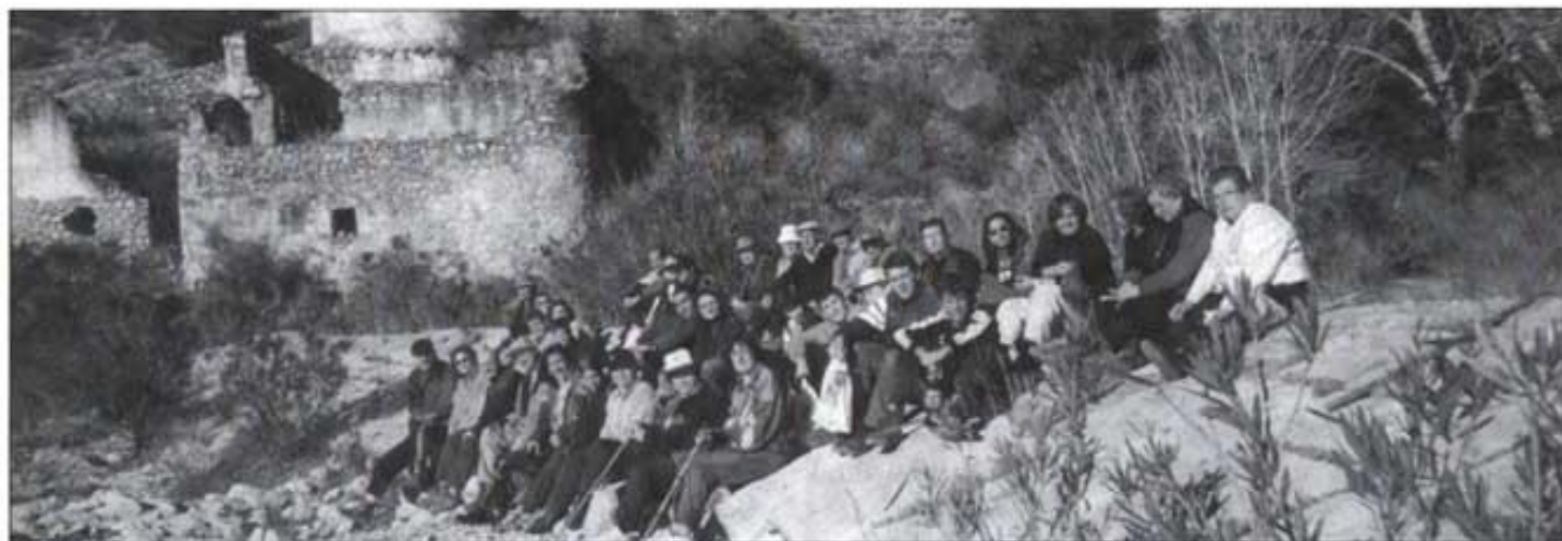
Qui li havia de dir al molí l'om que s'oplegaria tanta gent per admirar-lo?

A més de tot l'interès de la visita, cal subratllar la varietat d'edats dels participants i de les seues ganes de recolzar a Benjamí per a no deixar perdre més parts de la nostra història. Molts van suggerir crear una associació d'amics dels Molins de la Conca del riu de les Coves, la qual cosa seria una excel·lent idea.