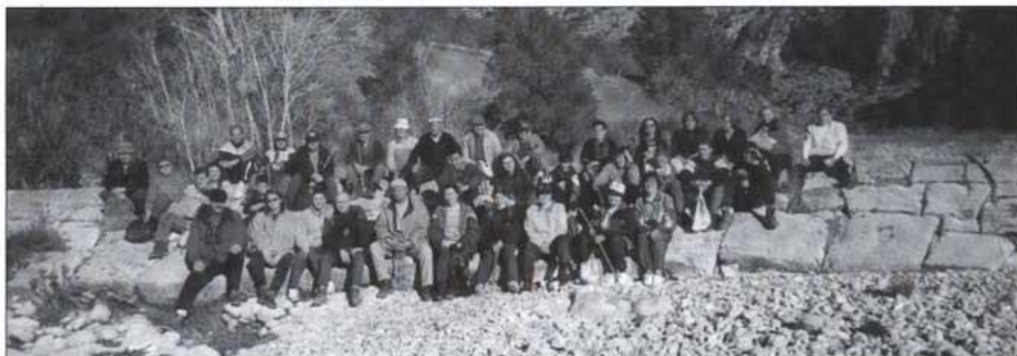
Les velles pedres de l'assut van agrair la visita.