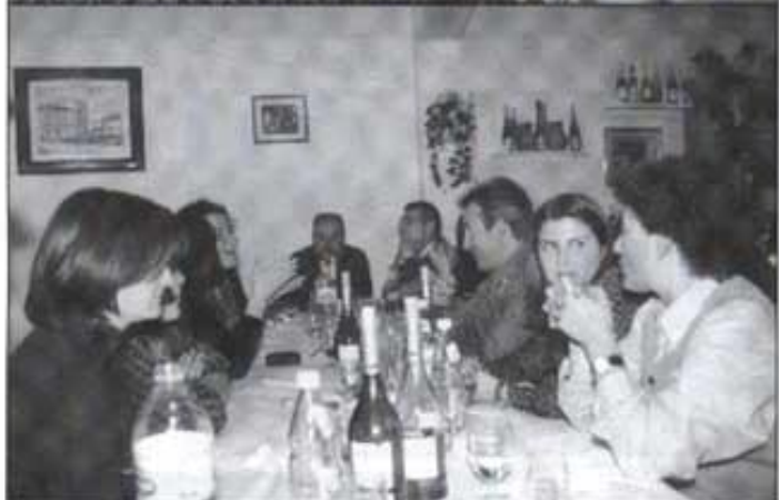
El tercer sopar de Col·laboradors de Tossal Gros es va celebrar amb gran cordialitat i arreplegant forces per tal de continuar endavant.