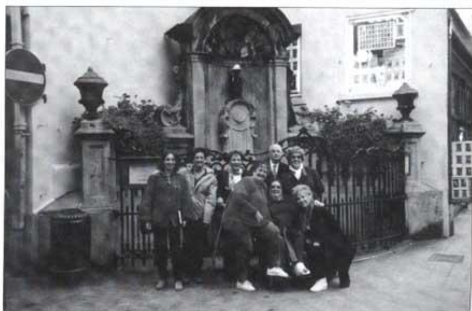
Hannekenpes i els millors del grup. Bruselas (Bèlgica).