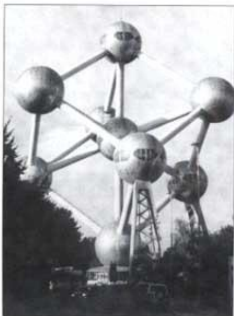
Atòmium de Bruselas (Bèlgica).