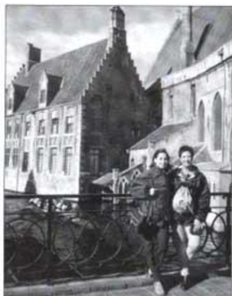
Canals de Brujas (Bèlgica).

A les quatre de la vesprada vam continuar amb el trajecte fins les nou de la nit que vam arribar a Lyon, on vam fer nit després de sopar al mateix hotel. De camí, per l'autopista, ens van adelantar cents i cents de motos i als ponts havia gent que treia els dits fent el signe de victòria. La nostra simpàtica guia es va encarregar de preguntar en un àrea de servei francesa què significava tot allò i uns xics molt agradables ens van explicar que