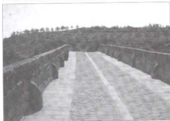
El pont de la reina.

Va arribar el mes de maig, i, amb el suport incondicional de la meua muller, vaig prendre la decisió: el mateix dia en que acabava el curs intentaria de fer realitat eixe somni, el Camí de Santiago. El projecte era senzill: recórrer, en trenta dies com a màxim, els 760 km que separen Roncesvalls de Santiago de Compostel·la, amb la motxilla (que no superaria els 10 kg) carregada a l'esquena i dormint als albergs. Aniria tot sol; la companyia, ja la trobaria al camí.