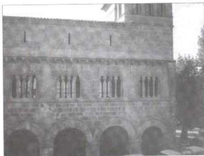
Antic palau del reis de Navarra. Estella.

Els meus amics m'auguraven una tornada ràpida –a tot estirar, cinc o sis dies de caminar per eixos camins–, i jo mateix dubtava de les meues possibilitats. Solament la meua dona sabia que, exceptuant impediments insalvables, arribaria a Santiago i que ni la fatiga ni el cansament no me'n dissuadirien.