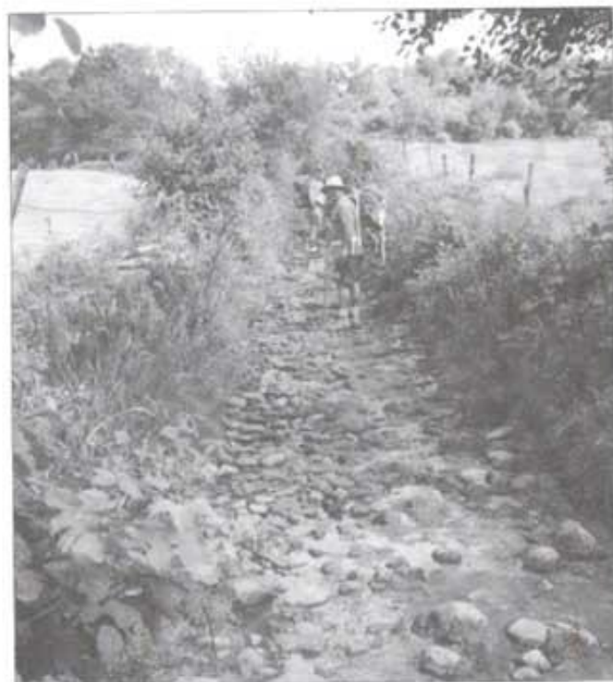
Caminant entre l'aigua i el fang.