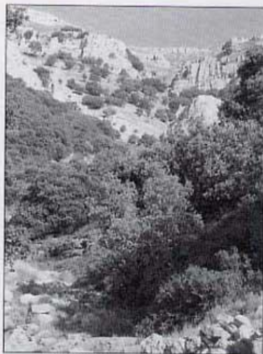
Foto 7: El barranc d'en Soroll, per on descendirem del Tossal de la Nevera

na -anomenada després rambla de la Valltorta- fa de divisòria entre els termes municipals d'Albocàsser i de Tírig. Per tant, nosaltres ja no circulem per cap d'ambdós termes sinó pel mig de tots dos termes.