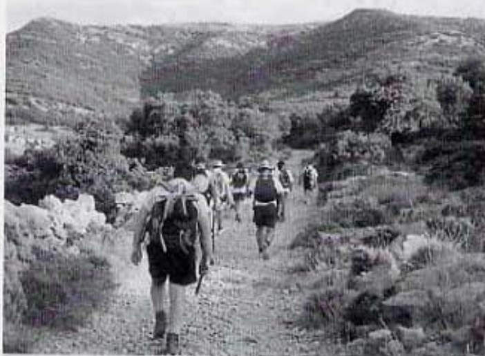
Camí de Salvassòria.

Al lloc on dinàrem estava l'equip de futbol de Villareal, que just ho van fer abans de nosaltres, i també Canal 9 per tant d'informar a tota la comunitat dels passos del Villarreal, aquest any tot un equip de primera. Després ens vam fer el retrato commemoratiu, i cap a