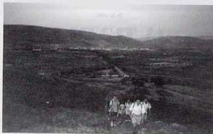
Pujant cap a l'Avellà.