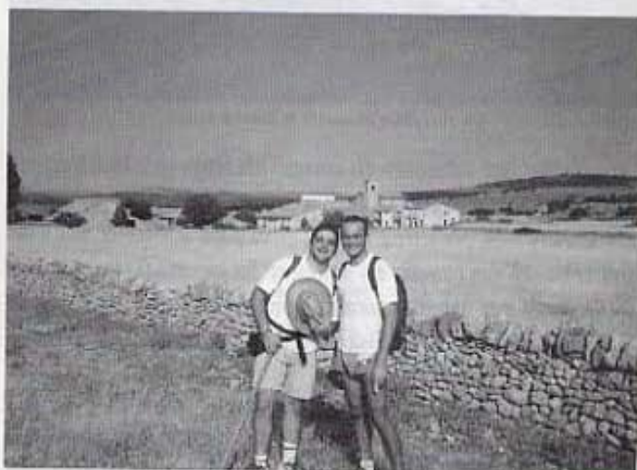
Ja hi som a la Llèqua.