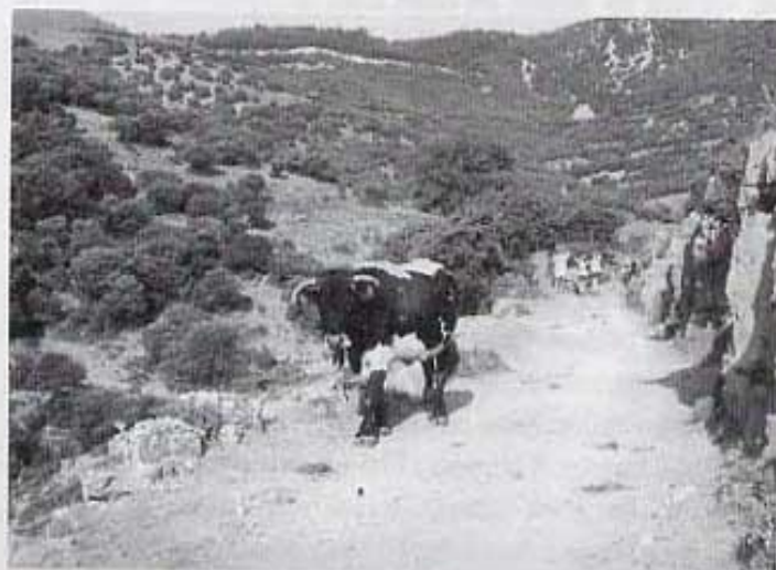
Jugant-se la pell, fotografià al manso.