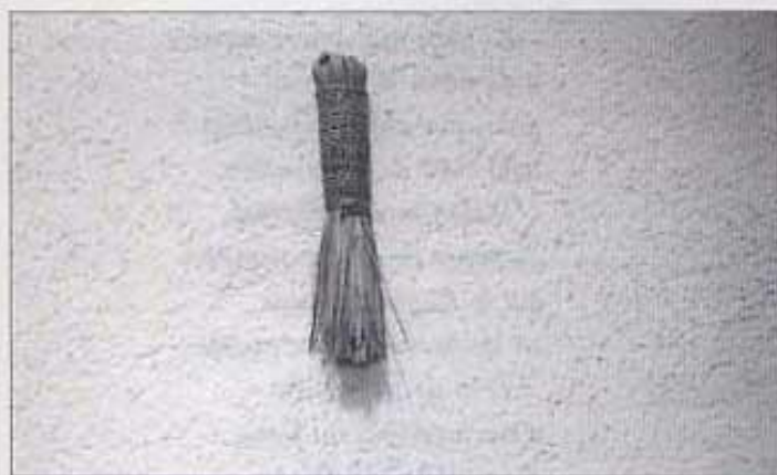
GRANERA DE PASTERA.