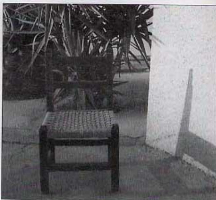
CADIRA AMB CORDATGE DE PALMA.