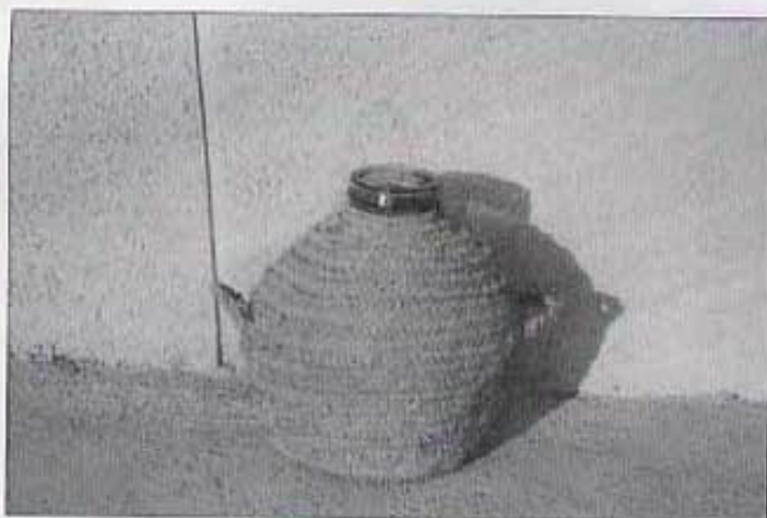
GARRAFA REVESTIDA DE LLATA.

poble, abastava, fins no fa gaire, les necessitats del món camperol.