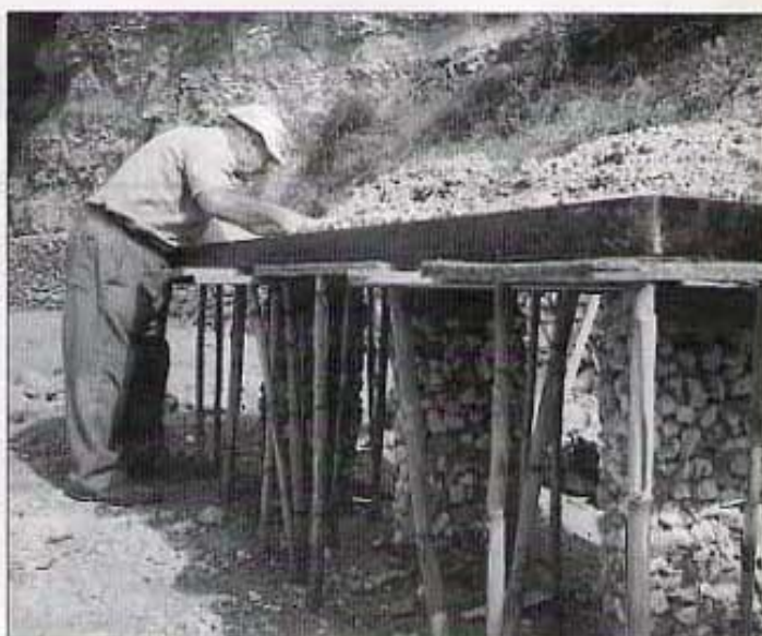
APUNTALAMENT CURIÓS D'ENCOFRAT DE LA TAULA.