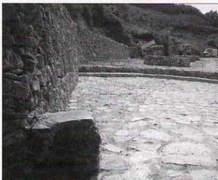
S'HA ACABAT EL FANG.