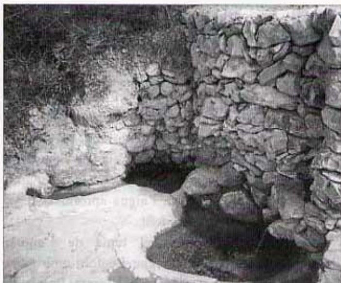
FONT DE BOIRA.