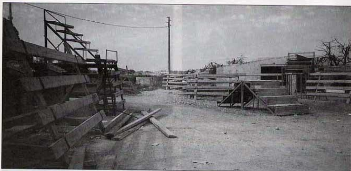
La plaça de bous, solitària.