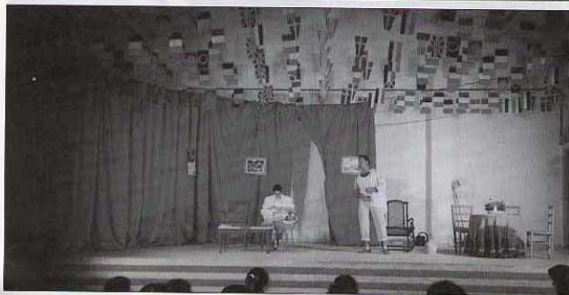
Comença el teatre.