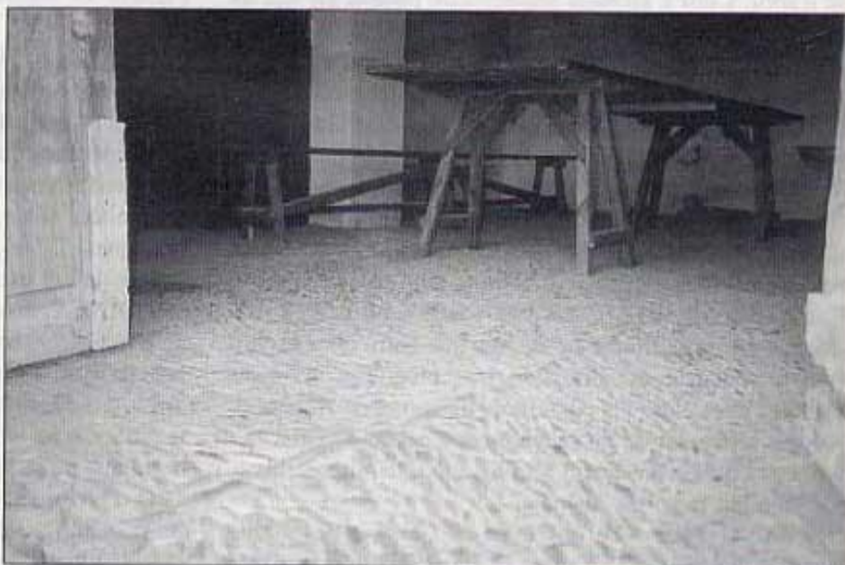
Sòl de l'entrada de la casa.

La nostra alimentació consistia en les collites i la matança (de bou, cabres o bacó), que es repartia en el transcurs de l'any. Teníem terra de pa, panís i patagues, un ramat d'ovelles, un altre de cabres, de burres, éguies i matxos uns set o vuit. Les raberes eren nostres i teníem un pastor que ja cobrava un duro al dia. Quan segàvem, ficàvem les garbes (els mitgers) de dos en dos i l'amo n'escollia una, sempre de la mateixa mà. Recordo ací a l'era quan batíem i que, una vegada fet el muntó del gra, l'entràvem tot al muscle cap a la casa en lloc de fer-lo amb el carro. Eren costums que ara no ho faríem aixina. Però hi havia una dita que deia: lo sac ben gran, ben ple, carregar-lo ben alt i en ser a casa ben amunt. Si no fas açò, en esta casa, no eres home . També, pel que fa al panís, feien dos muntons i l'amo agarrava el que volia. Respecte a vinya teníem macameu, vernassa, morrastrell... tréiem uns 600 o 700 cànTERS (decàlitres) de vi. El picàvem amb els peus, bollia vuit dies, el tréiem, el prensàvem i, en bótes, a la bodega. Com en teníem tant, el veníem. Què vols saber?...que d'on tréiem