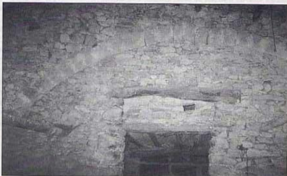
Arc de les corralisses.