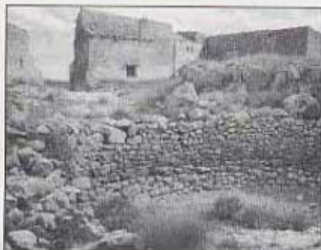
Bassa del Mas.