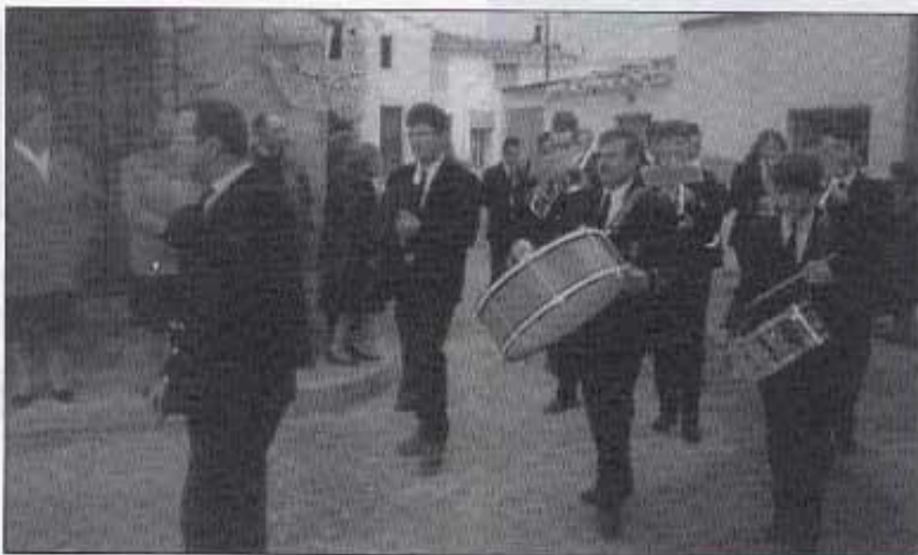
Banda de música.