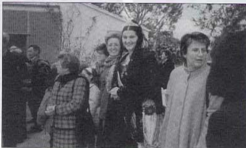
Acudí la Regina.

Musical Covarxina, diari local Tossal Gros...i tantes persones que ens ajuden, ja que la festa és de tots.