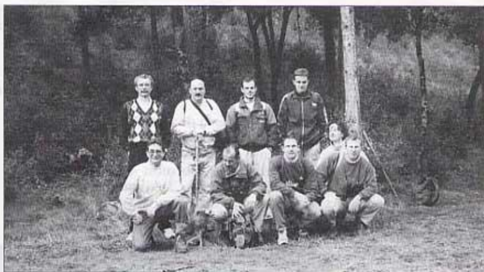
Grup que vam fer l'excursió.