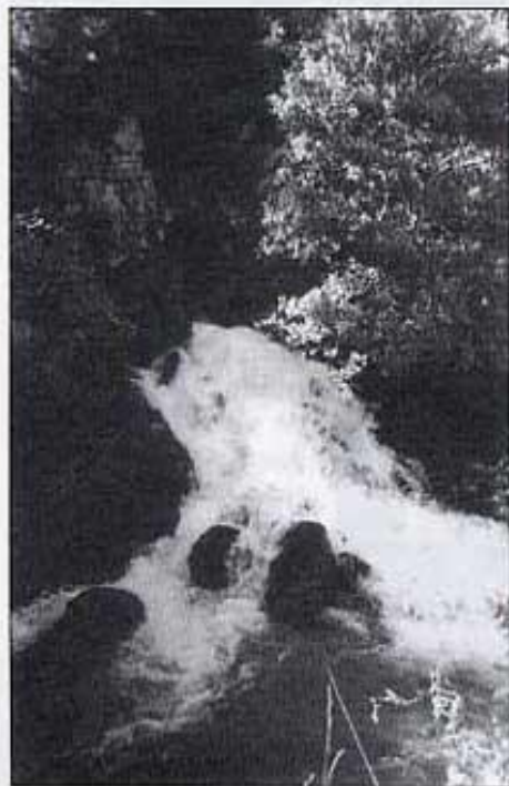
L'ullal de la rambla d'Atzeneta.