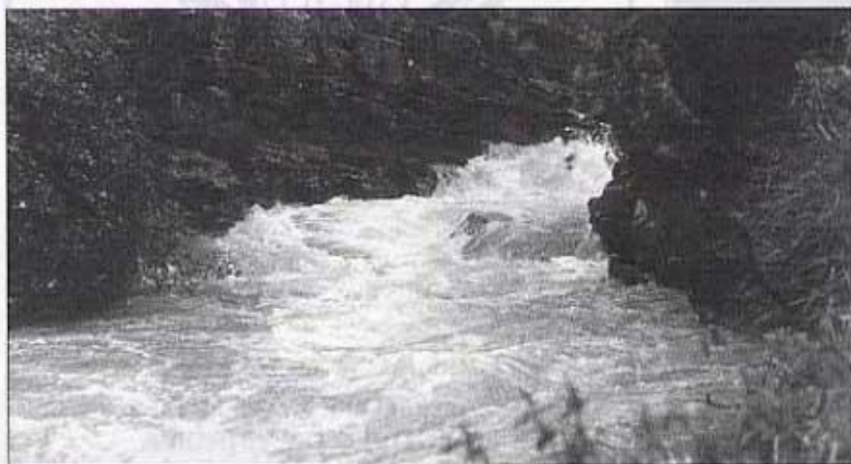
La Rambla d'Arzeneta.

això s'anava perdent, que si era una veritable llàstima, que si podríem fer alguna cosa al respecte, que si... bé!, com us estava dient, la taula de "railite" va començar a quedar-se menuda de tantes idees com anaven eixint. Aprofitant aquella mena de pluja d'idees -això que els anglesos, cabuts com ells a soles i embolicadors com no hi ha altres, diuen "brainstorming"- algú va atrevir-se a preguntar si podríem dur endavant un projecte com aquell, i, com per un d'aquells atzars del destí, s'havien ajuntat un nodrit grapat de gent emprenedora, ningú no va trobar inconvenients. I, ja sabeu què passa en aquests moments, cada persona de les que allí es trobaven, va oferir-se per fer una part del treball: uns pensarien en un nom emblemàtic, uns altres donarien les idees-base, a partir de les quals els altres redactarien els estatuts, els altres els durien al registre per a quedar constituïts com a associació, i quan tot això estiguera fet, es faria una reunió per donar-la a conèixer a la resta del poble.