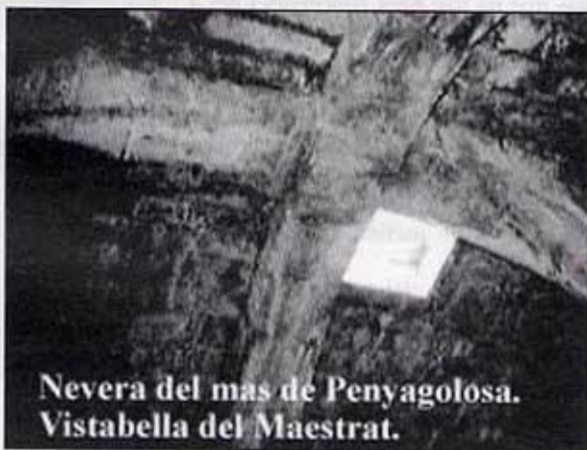
Nevera del mas de Penyagolosa. Vistabella del Maestrat.

Que aquest article servisca també d'homenatge a tots els nostres avantpassats, els quals, en plena nevada i amb els músculs entumits del fret, es desplaçaven cap a les neveres per -una vegada apareguda la blanca matèria