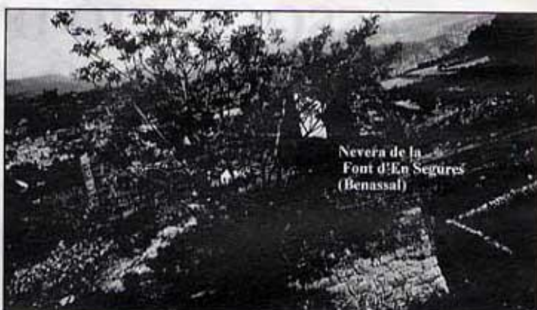
Nevera de la Font d'En Segures (Benassal)