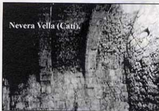
Nevera Vella (Cati).