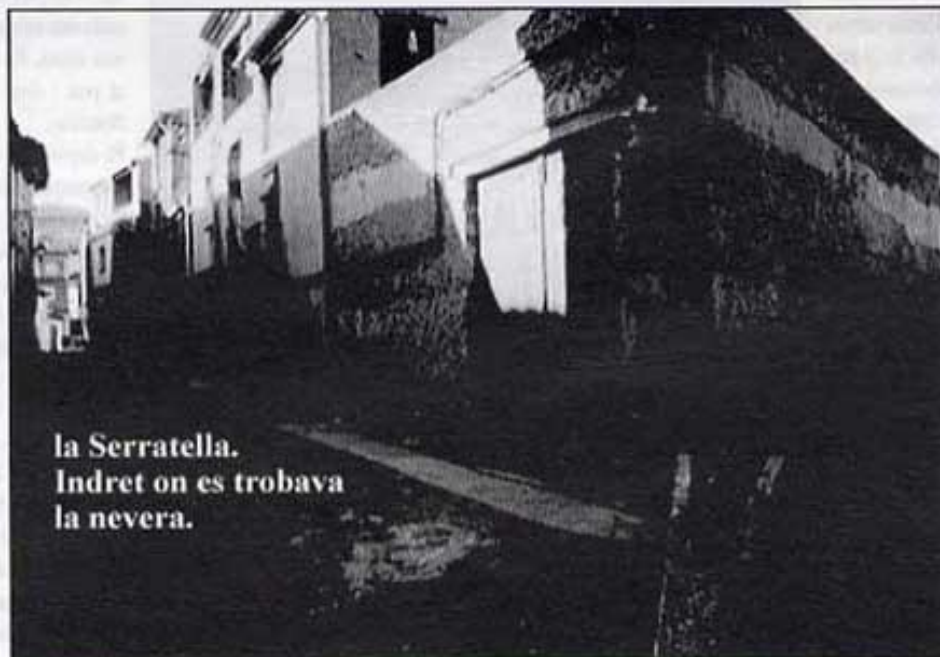
la Serratella. Indret on es trobava la nevera.

-nevera de la moleta del mas Rois: gelera rudimentària, totalment derruïda.