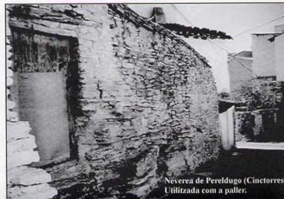
Nevera de Pereldugo (Cincorres) Utilitzada com a paller.