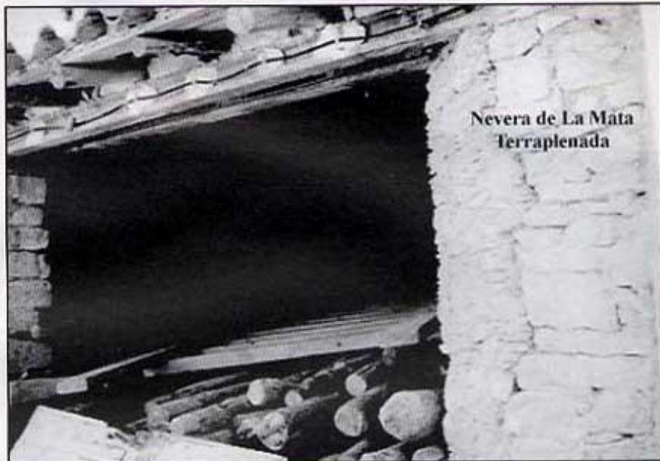
Nevera de La Mata Terraplenada

La planta de la nevera fa 9'60 m. per 7 m. de costats i els murs estan arrebossats amb morter de calç. El pou té uns 7 m. de profunditat, encara que, actualment, hi ha molts enderrocs de l'estança superior. Als murs hi ha buits per a encaixar