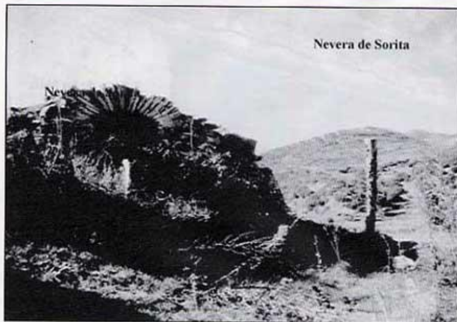
Nevera de Sorita

més posen en comunicació aquesta sala amb les habitacions adjacents. L'edifici principal del Castell del Baró és dels segles XIV i XV, tot i que la sala que conté la nevera és posterior. El sostre s'ha enfonsat ja parcialment, per la qual cosa perilla el seu relativament bo estat de conservació.