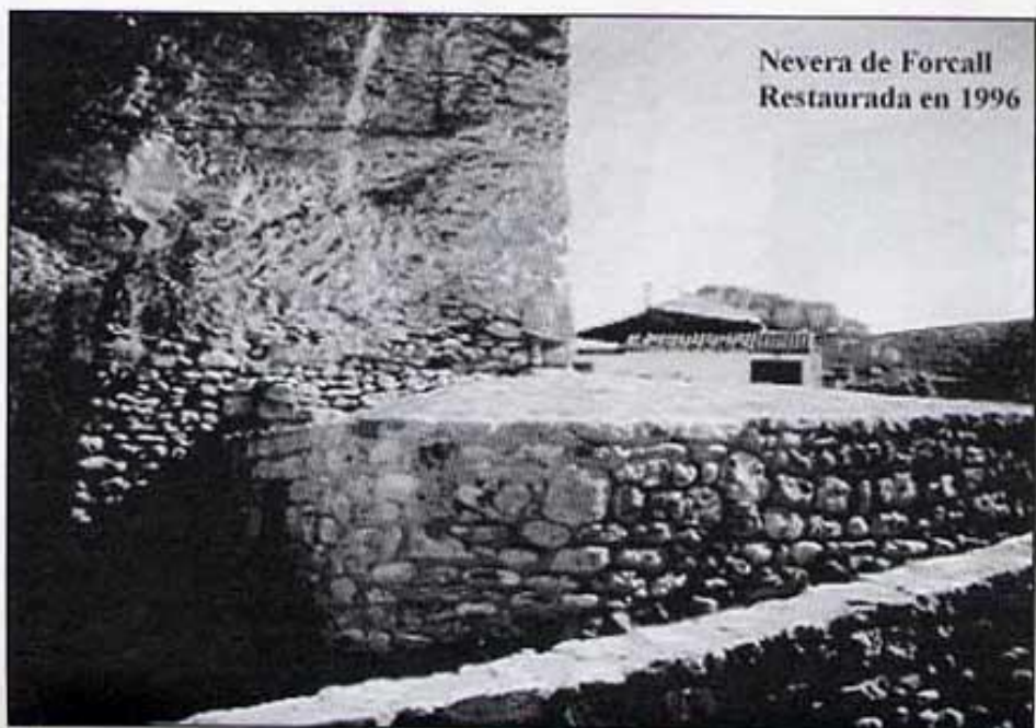
Nevera de Forcall Restaurada en 1996