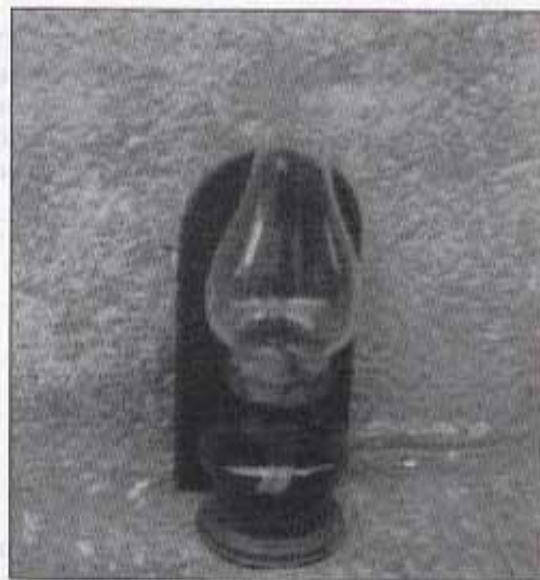
Quinqué. De vegades posaven una tulipa per la volta per a que no molestara la llum.