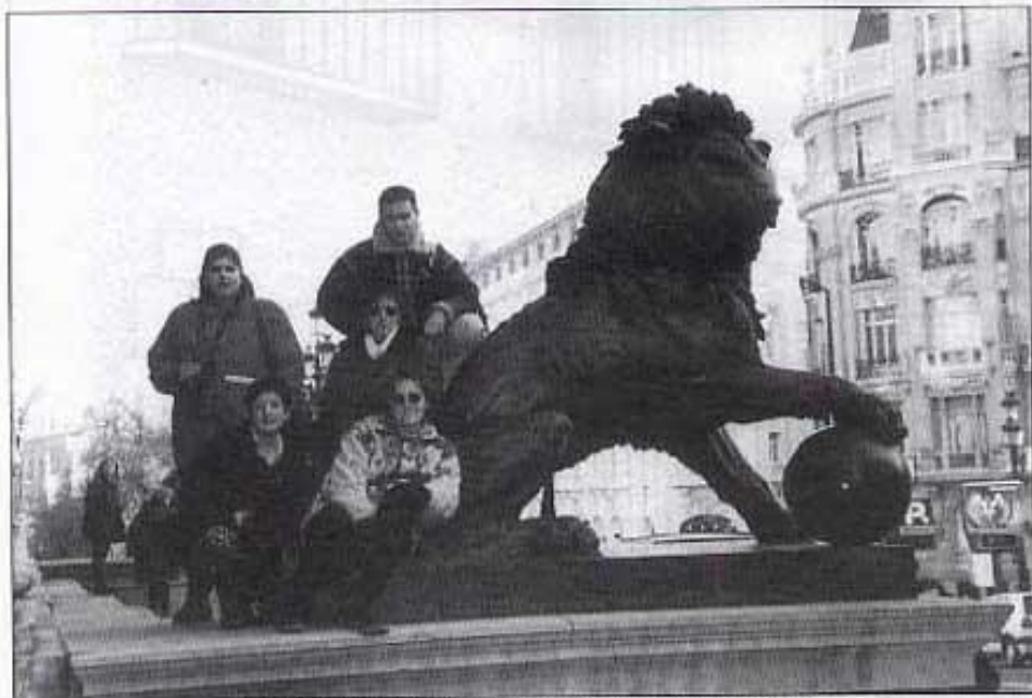
El lleó del Congrés dels Diputats: Darrere l'hotel "Palas".

la gent pujant. Vam fer la mateixa operació que els altres passatgers i un cop en marxa encara no ens creïem que anàvem cap a Madrid.