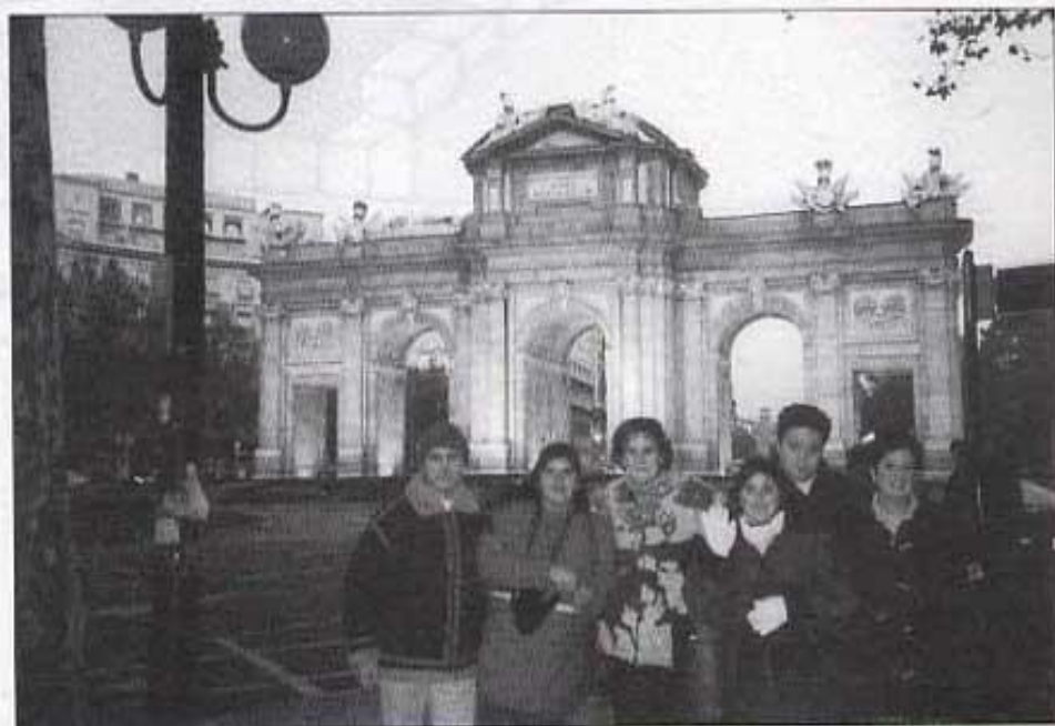
Mírala, mírala, allí està la "Puerta de Alcalá"

Baixant pel carrer Alcalá amb la falda almidonà i..., vam arribar a "La