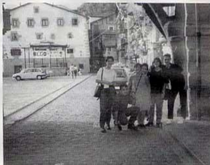
Itziar, els "turistes" i, al fons, la plaça "Pasaia".

El tren que ens portava a Benicarló va tardar dues hores i mitja en eixir i mentre vam anar a un bar a