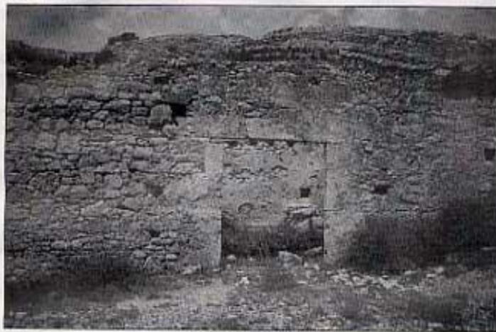
La porta del molí.