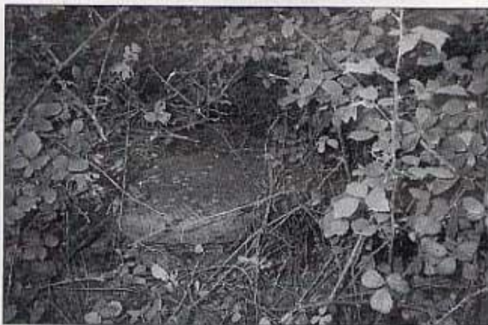
Tallats els albarzers es veu la mola.