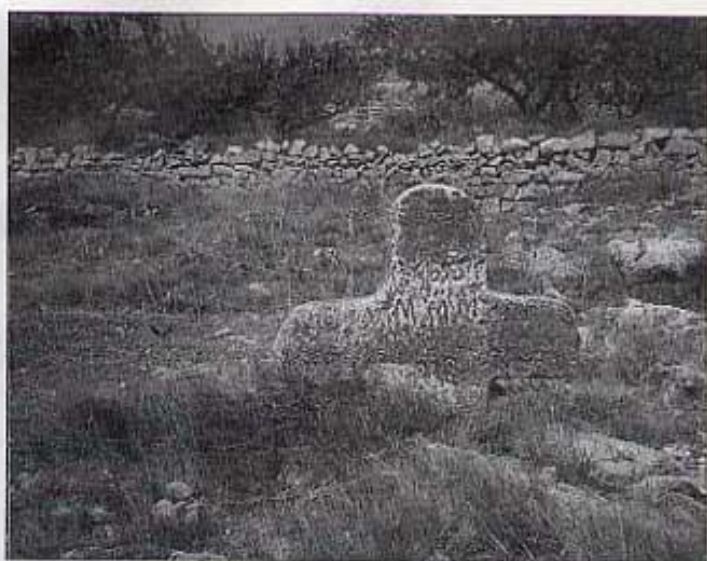
Entre la creu i la paret passava la sèquia.