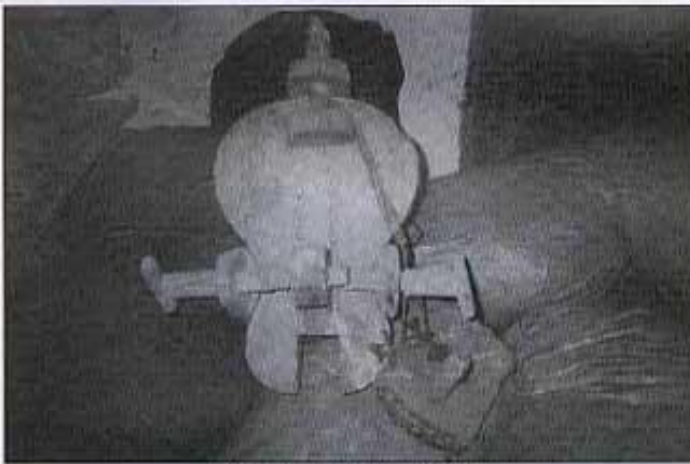
El motle per a fer guitarres.