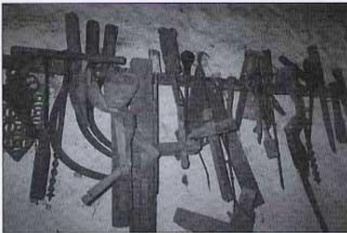
Estris de fuster.

quina regla de tres. No puc assegurar si esta història és verídica o no, però també he sentit dir que, encara més antigament, este Mas s'anomenava de les Saleretes*.