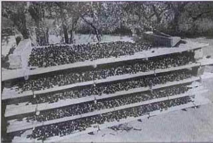
Canyissos per secar olives.