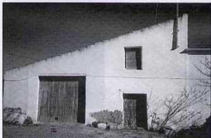
El Mas de Malagana. Part més vella.

"Això és difícil de saber. Jo sempre he sentit dir que el meu besavi se n'anava un dia a escoltar missa al Mas Nou, li va agarrar una desgana (un desmai) i des d'aleshores va passar de la paraula desgana a malagana, no sé per