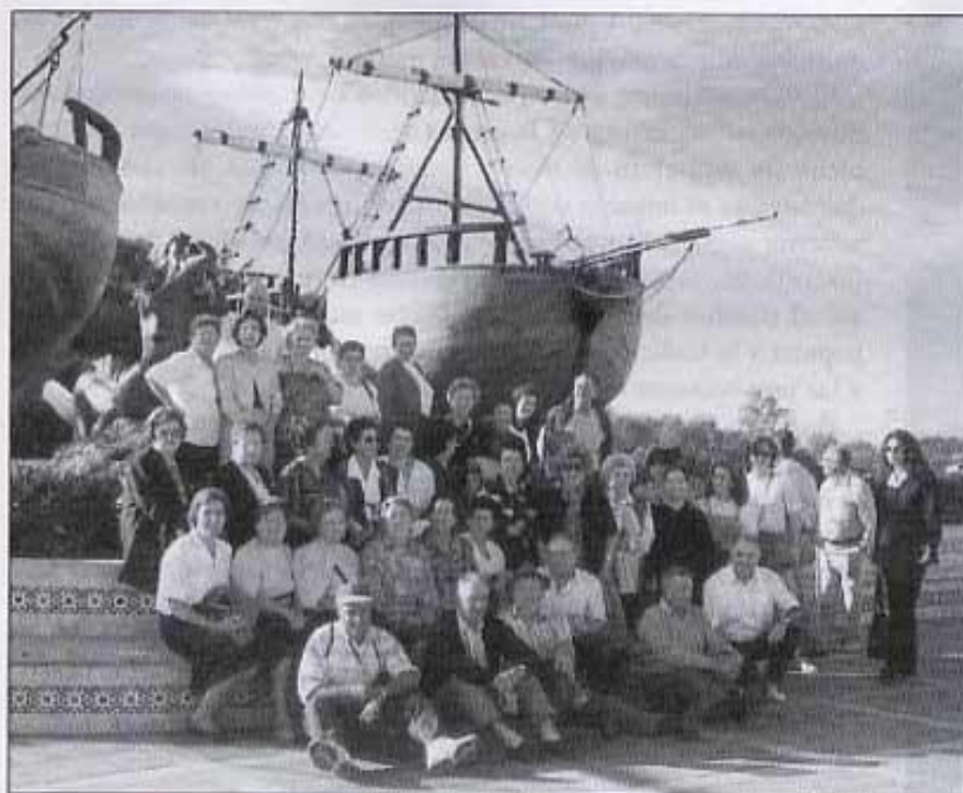
El grup que hi vam anar

Burgos és una ciutat amb molta història i té uns cases antics molt interessants. Després de dinar anàrem en direcció a Les Coves. Finalment a les 11 de la nit, ja érem a casa nostra.