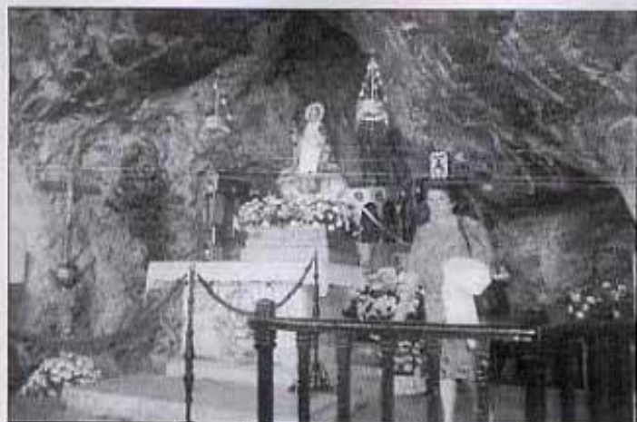
Verge de Covadonga (Astúries)