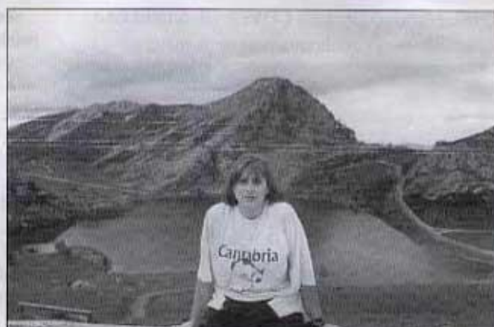
Els llacs de Covadonga (Astúries)