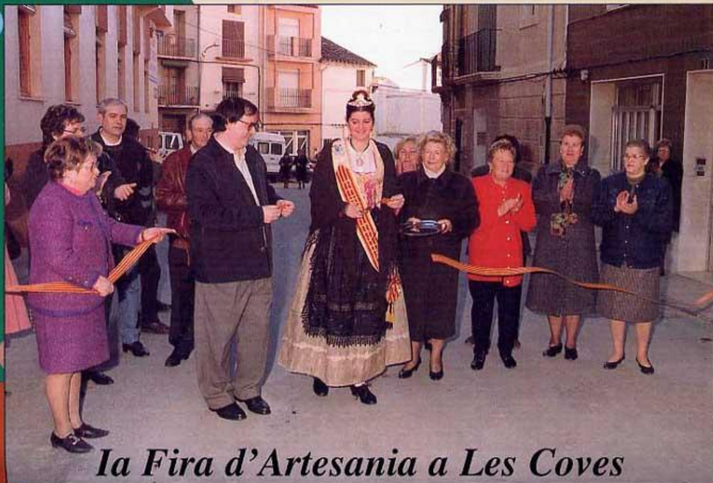
La Fira d'Artesania a Les Coves