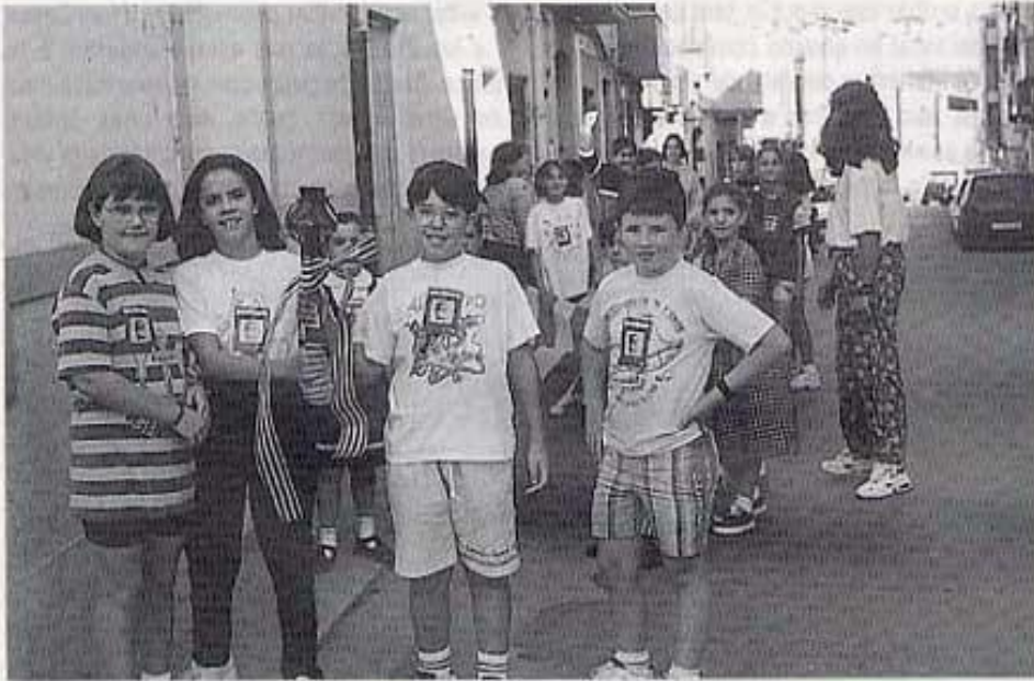
Portadors de la torxa

per fer-ho necessitem cap traducció simultània. Tots els dies la Universitat que, ara per ara encara és pública i manté certa autonomia, és atacada per polítics (algun d'ells inmigrat de Cartagena) que pretenen manipular-la i desautoritzar-la, imposant criteris que només obeeixen a interessos partidistes i feixistes. Segurament amb la intenció de privatitzar-la molt aviat per fer-la menys deficitària, i així reduir la inflació de l'Estat i poder entrar a la moneda única (?).