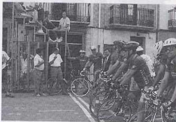
Cursa de bicicletes

típiques per guanyar el conill i el pollastre i després fer una bona paella en tota la colla per despedir les festes.