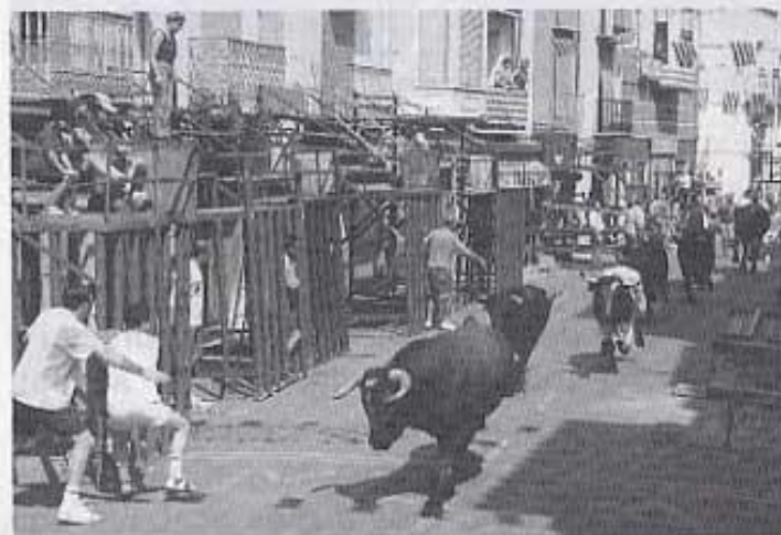
Bous de vila. Entrada