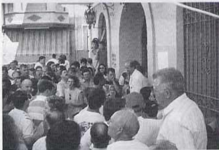
Subhasta de cadafals

Els bous embolats cada dia fan menys festa i s'haurà de plantejar si continuar portar algun bou que siga menys veterà i done més joc. Tot i que hi havien programats quatre dies de bous de plaça, la gent no tenia prou i en van demanar dos dies més, cosa que va fer que la plaça estiguera dividida a l'hora de demanar-los, uns estaven cansats, i uns altres no. Però el que més es demanava eren vaquetes a la matinada, ja que són el que més agrada a la joventut i també a altres persones no tan joves, ja que en acabar la revetlla la gent està molt animada i té ganes de gresca i poca son, i unes vaquetes abans