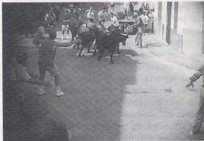
Entrada per R. València