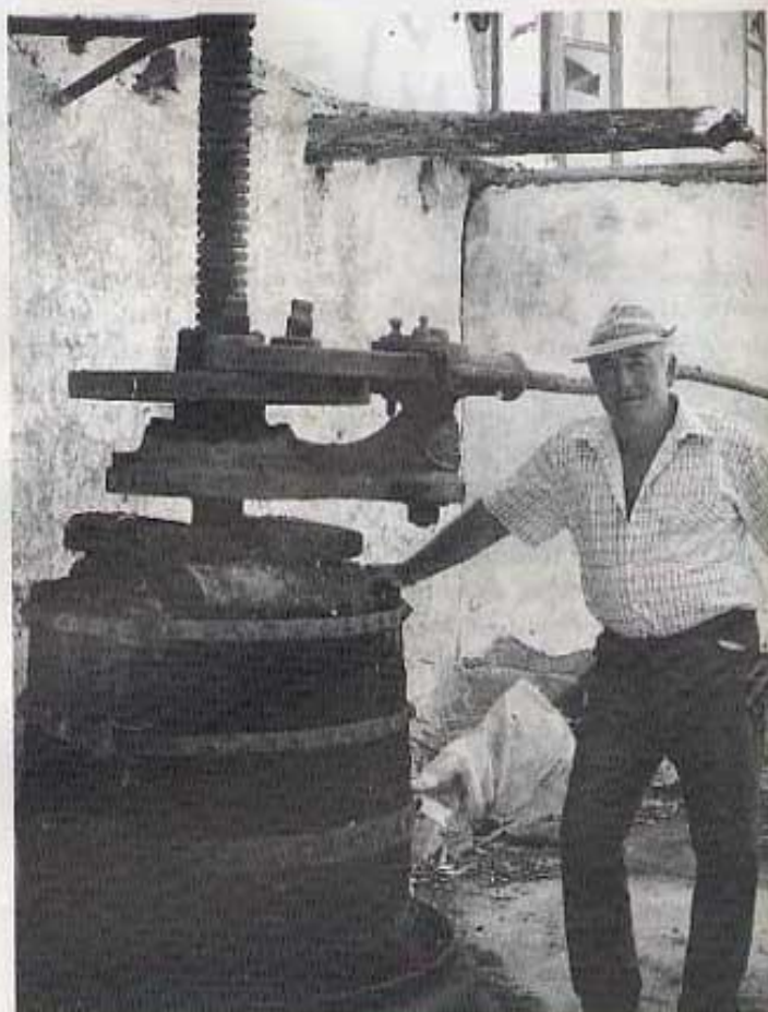
Premsa de raïm