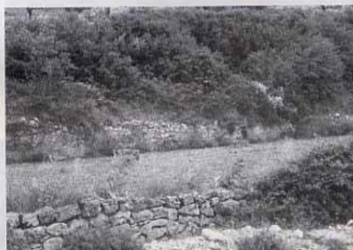
Darrere la paret és la sèquia