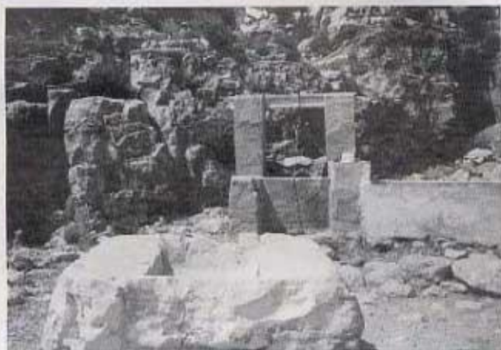
El pou de la rambla