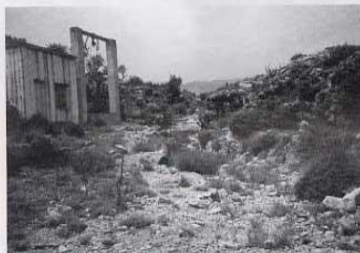
Barranc del Gatellà. On era l'assut