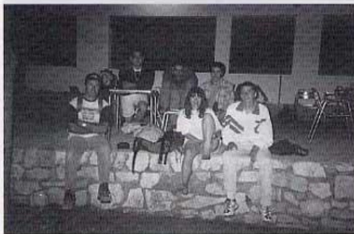
El segon grup a Catí