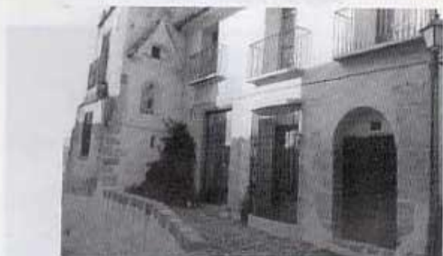
Casa de "les Senyoretas de D. Miquel"