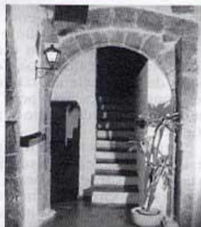
Pub Vértigo (antiga Casa de la Vila)