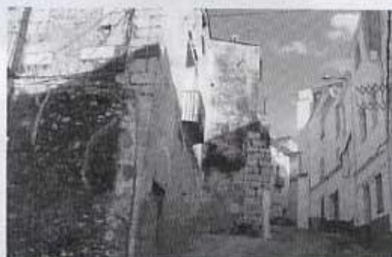
Portal de l'Hospital