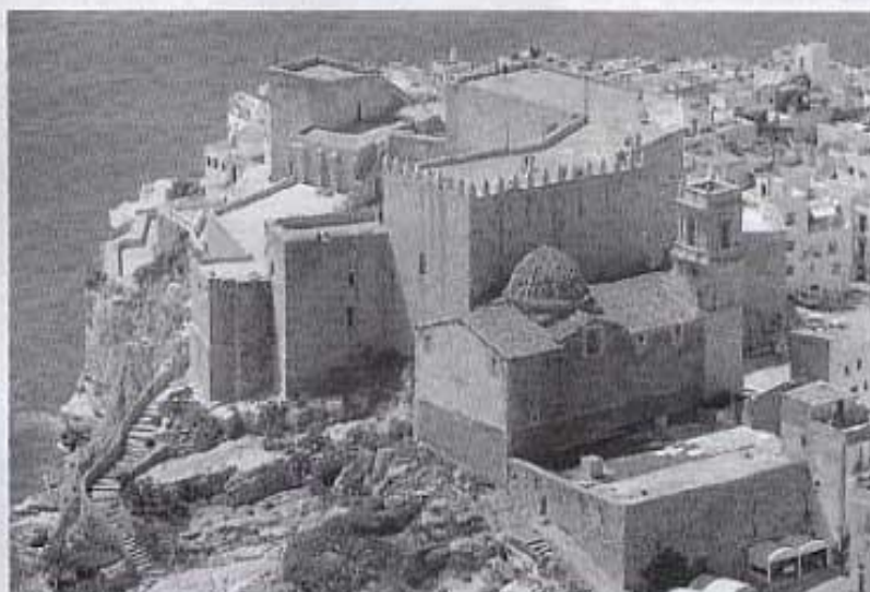
Castell de Peníscola.