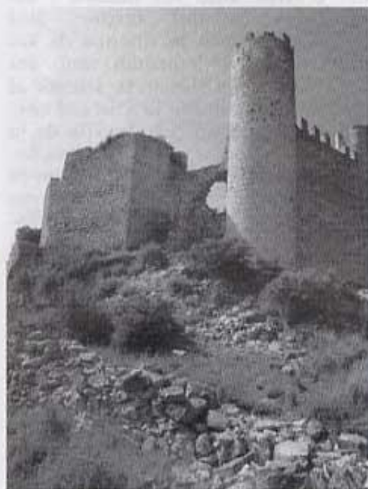
Castell de Xivert.

per a quan es conquistessen, donà al Temple les primeres fortaleses en territori castellanenc: Xivert i Orpesa en 1169 i Montornès en 1181.