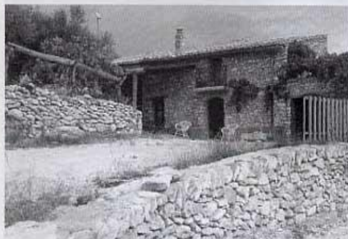
Entrada al mas.