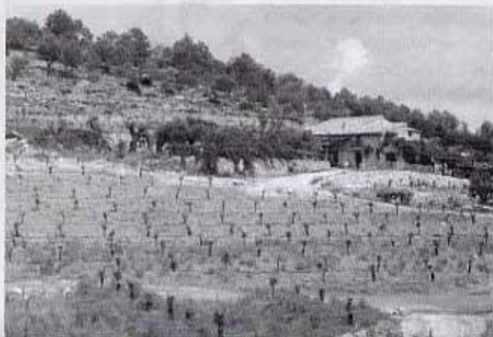
Transformació de terres.

Aixina, puix, a la Partida de Baix, a uns 8,7 km. de la font de Company i anant cap a Torreblanca a mà dreta, trobareu el Mas de la Menescalà transformat en una finca de ben segur més rendible que la d'abans.