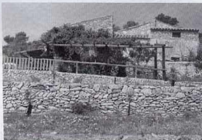
Mas de la Menescalà vist des de la carretera.

amb la intenció de donar-li el sabor d'un Mas antic. S'han conservat les parets de càrrega amb la pedra cara -vista i inclús, per dins, les habitacions han respectat la forma original i -ornant les parets-