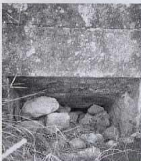
Entrada a la rampa

cions del voltant, és rectangular i molt petit. Vist des de fora, amb els blocs de pedra picada de les cantonades, la teulada ben conservada i d'aspecte cuidat, pareix que no hagi passat el temps. Però dintre poc queda d'aquest molí. La sala de moldre, amb una volta de dovelles per sostre, ha esdevingut un galliner.