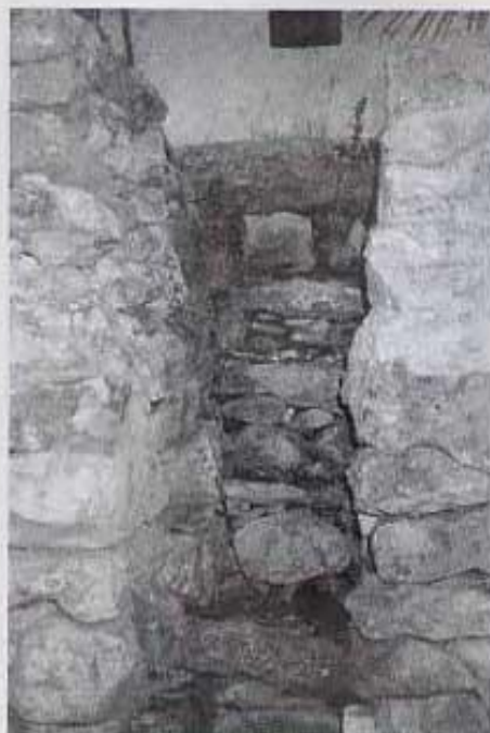
Molí Matutano. Escalera exterior per baixar a la sala de moldre.