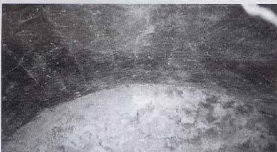
Molí Matutano. Sostre de la sala de moldre.