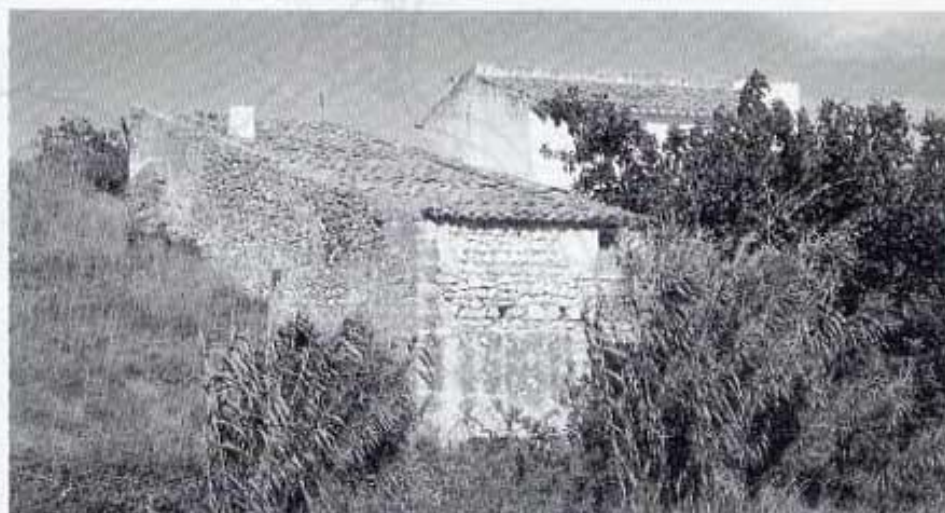
Molí Matutano. El molí.