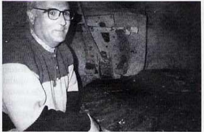
L'alcària del càrcol és la d'un home ajupit

la font i la d'un barranquet que baixa de la part del mas d'Amela.