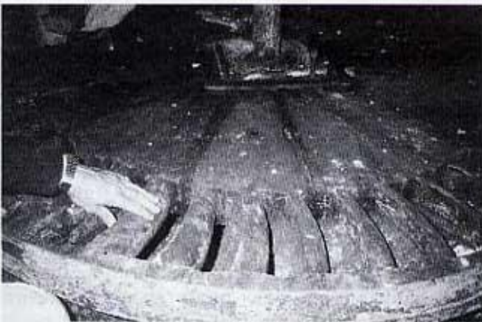
La ma ens dona idea de la grandària de la roda d'àlems

vats són dos: en l'un hi són les autoritzacions temporals per a molre, ( la mola del blat ja era precintada per obligar els pagesos a anar a la farinera) i en l'altre llibre figuren les