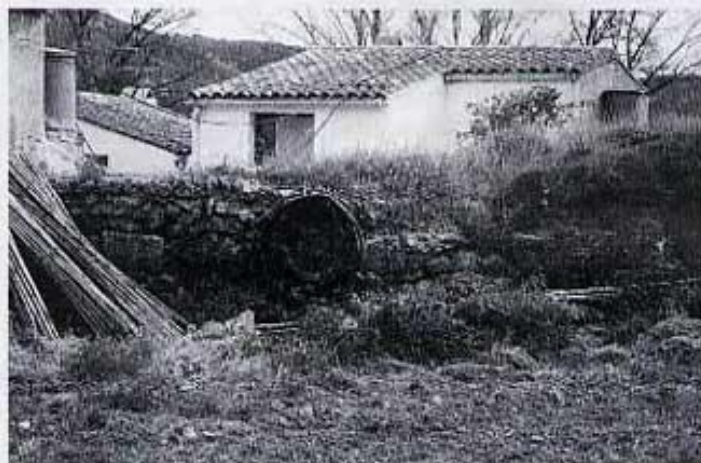
Restes de la paret de la bassa

La sèquia d'un quilòmetre de llargària es pot seguir en alguns trams, justament al principi i a l'acabament és on ha desaparegut. Agafava l'aigua sense assut, una paret senzilla situada baix del pont de la Venta la Figuera li canalitzava. Aquesta paret ha que-