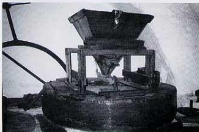
Mola aro i gronsa

Rebia aquesta sèquia un cabdal afegit a l'indret de la font de la Venta. Uns troncs d'arbre buidats i lligats amb cadenes, de les quals es poden veure algunes restes, duien vers la sèquia, creuant el llit del riu, l'aigua de