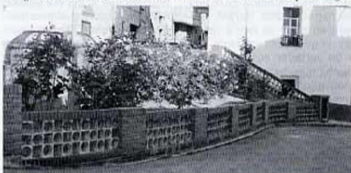
Antiga nevera de Vilafranca, terraplenada i convertida en jardí