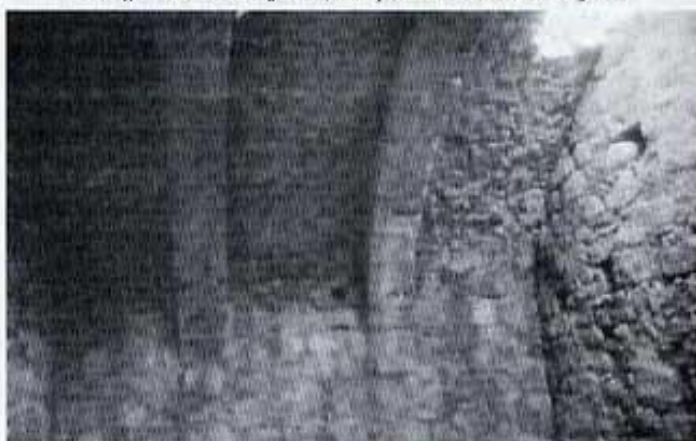
Nevera vella de Catí