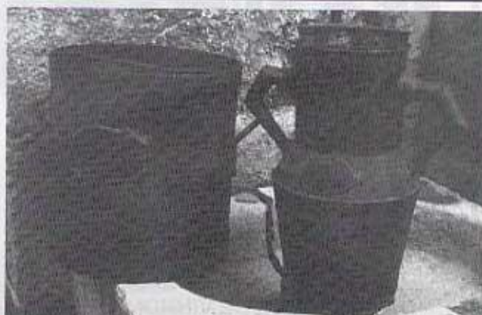
Mesures per a l'oli. Doble decalitre; Decalitre (té la mateixa forma que la rova però menys capacitat)