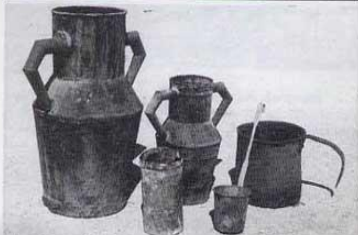
Mesures per a l'oli. Darrere: rova; quartó; sacadó (li cap un quartó). Davant: litre, sacadó (li caben uns 300 cl.)

*.- També s'anomena colze, colzada o mitja vara. - Altres mides eren el peu, la passa i la braça.