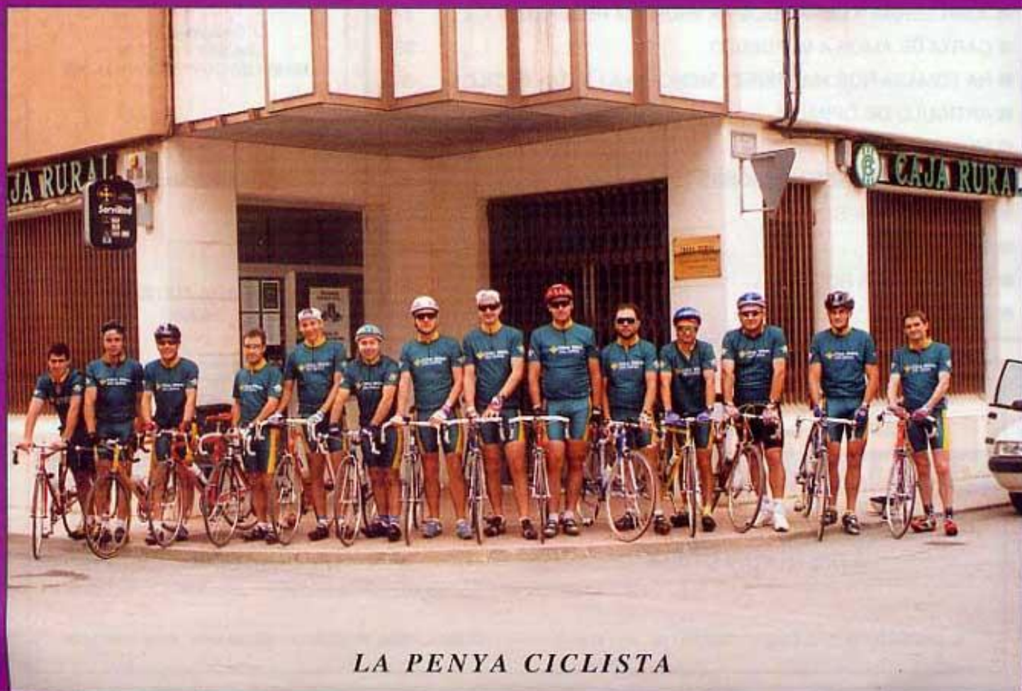
LA PENYA CICLISTA